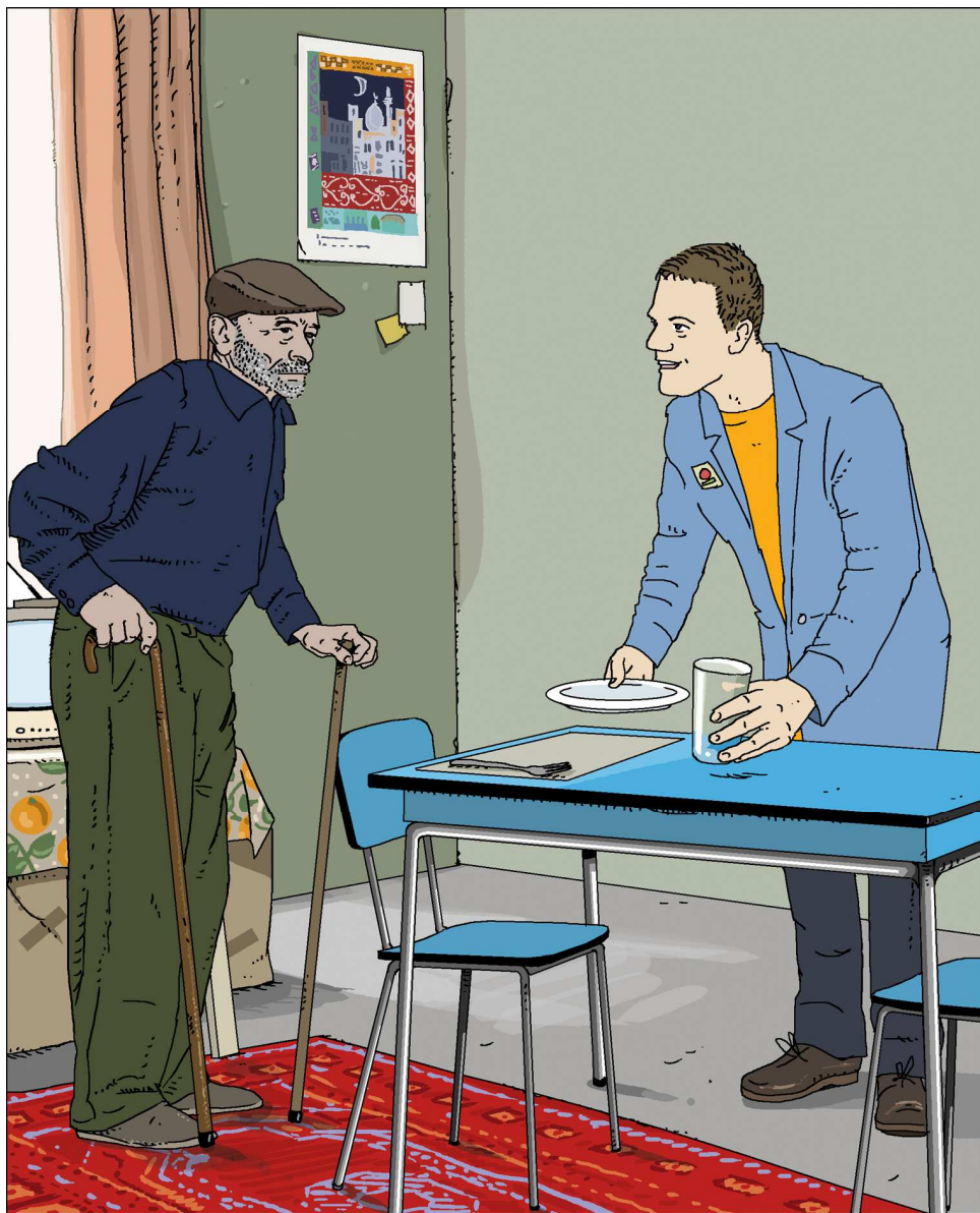
Mr B. paraît très inquiet quand l'Aide à Domicile aborde le sujet du repas...